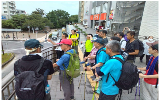
三鷹駅南口デッキから三鷹事件を学ぶ

延命寺に展示されている 250キロ爆弾の不発弾破片 境内には、空襲や戦争で亡くなった犠牲者の名前を刻んだ「平和顕彰百霊塚」も建立されています。