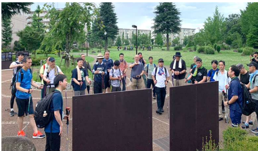
旧中島飛行機武蔵製作所・爆撃照準点

八王子歩み会 結成ポールdeウォーク 『旧中島飛行機武蔵製作所の軌跡と国鉄武蔵野競技場線を散策、 ミステリー三鷹事件を考える旅』