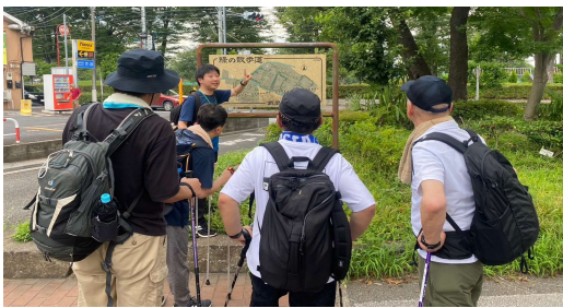
国鉄武蔵野競技場線跡 (グリーンパーク遊歩道)

都立武蔵野中央公園 今では広大のどが公園となっているこの地に、かつて東洋最大の航空機メーカー「中島飛行機」の大規模工場がありました。太平洋戦争中、国内で最新鋭の設備を誇る工場であったことから米軍の攻撃目標となり、1944（昭和19）年11月から終戦までの間に合計9回の空襲を受け、工場関係者はじめ、周辺住民も多数犠牲となりました。